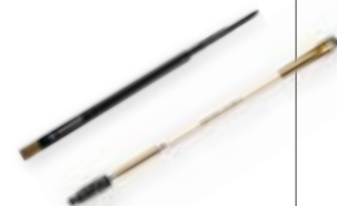
左 / Mac Brow Pencils, 右 / Rae Morris Eyebrow Brush and Brush Range